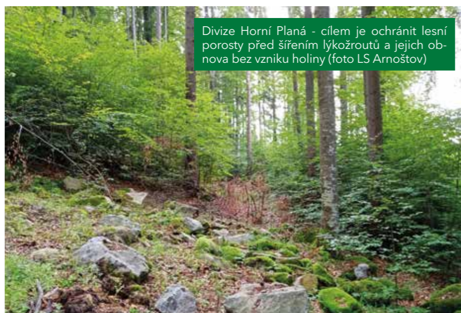
Divize Horní Planá - cílem je ochránit lesní porosty před šířením lýkožroutů a jejich obnova bez vzniku holiny