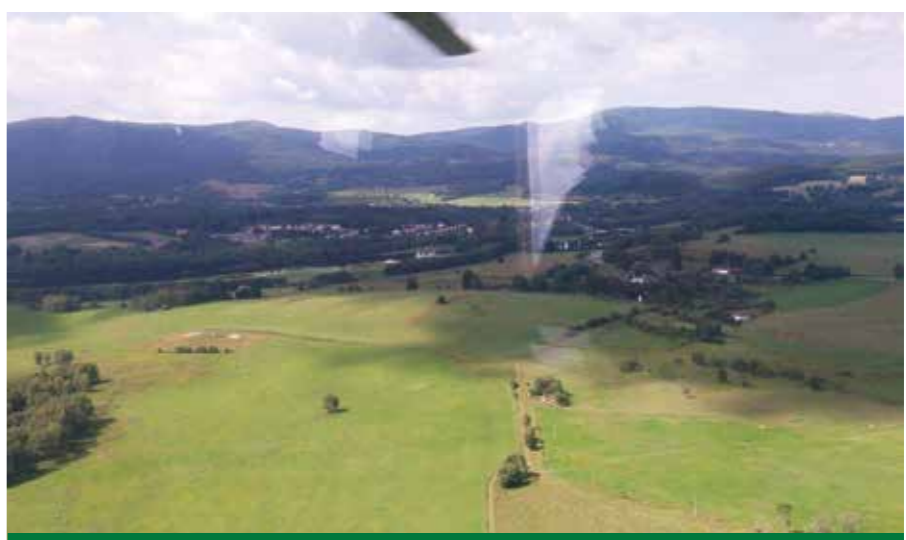
Dosud nepoškozené horské smrčiny na divizi Horní Planá.