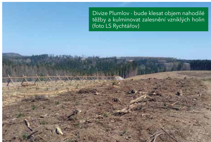
Divize Plumlov - bude klesat objem nahodilé těžby a kulminovat zalesnění vzniklých holin

Ani rok 2020 nebude, stejně jako posledních pět let, rokem vyznačujícím se standardním lesnickým hospodařením. Ačkoliv objem nahodilé těžby na moravských divizích výrazně klesne, a to především z důvodu, že plošným odumřením smrkových porostů prakticky vymizely smrčiny starší 20 - 30 let, celkový objem těžby výrazně nepoklesne. Těžiště se však přesouvá na české divize. Divize Mimoň se bude, stejně jako letos, potýkat s kůrovcovými těžbami ve smrku, které však na této "borové" divizi neohrožují podstatu lesního ekosystému. Mnohem větším rizikem je usychání borových porostů na celém území lesní správy Lipník, které je primárně způsobené výrazným poklesem hladiny spodní vody až o jeden metr. Navýšení těžeb se týká i divizí Hořovice, Horní Planá a Karlovy Vary, kde bude prioritou zabránit důsledným zpracováním a asanací zpracovaného dříví šíření lýkožroutů. Jako velice pozitivní se jeví meziroční pokles potřeby sadebního materiálu, kdy bude oproti letošním téměř 23 milionů sazenic zalesněno "pouhých" 12,5 milionů kusů. Reálně to znamená návrat na úroveň let 2016 a 2017. Kromě umělé obnovy lesa sadbou budou využívány i další metody jako např. obnova sjezími na ploše 65 ha, využití přirozeného