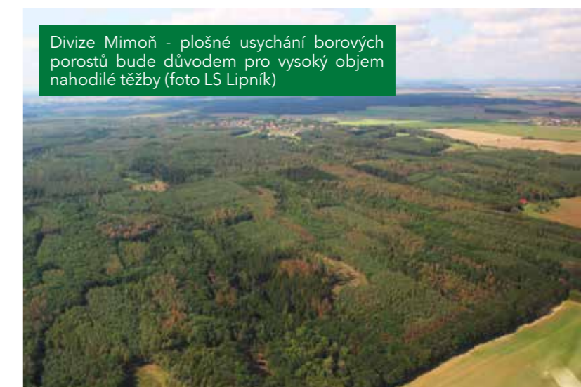
Divize Mimoň - plošné usychání borových porostů bude důvodem pro vysoký objem nahodilé těžby