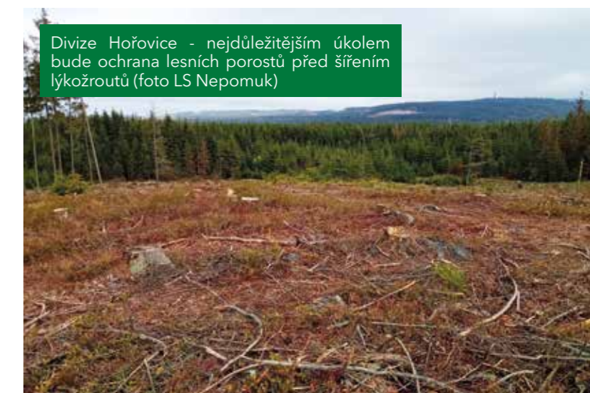
Divize Hořovice - nejdůležitějším úkolem bude ochrana lesních porostů před šířením lýkožroutů