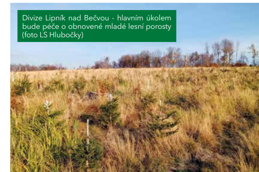
Divize Lipník nad Bečvou - hlavním úkolem bude péče o obnovené mladé lesní porosty