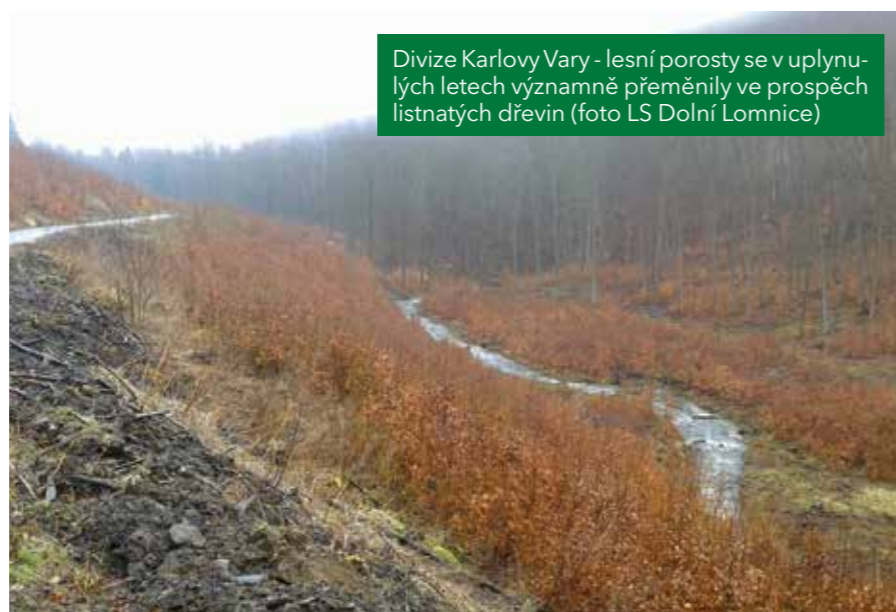
Divize Karlovy Vary - lesní porosty se v uplynulých letech významně přeměnily ve prospěch listnatých dřevin