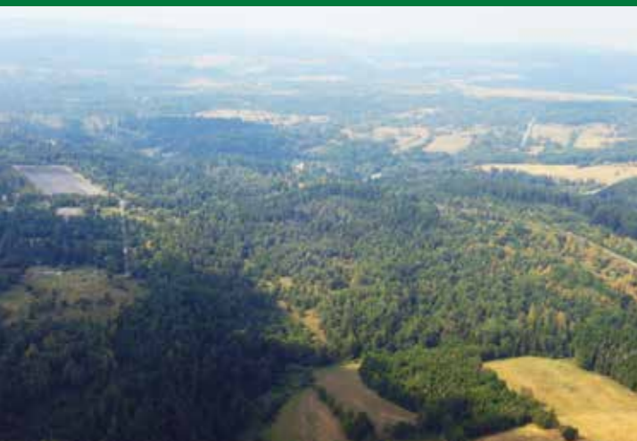
Smrkové porosty divize Horní Planá při pohledu od jihovýchodu přes vodní nádrž Lipno a obec Horní Planá.