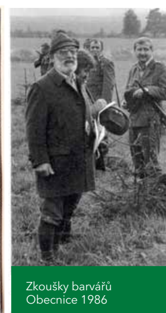
Zkoušky barvářů Obecnice 1986