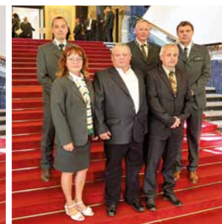
divize VLS Karlovy Vary