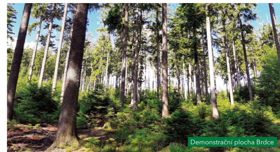
Demonstrační plocha Brdce

Došlo ke stabilizaci 10 demonstračních ploch (dvě na každé lesní správě). Demonstrační plochy mají rozlohu 40-75 ha a budou na nich uplatňovány a demonstrovány zásady výběrného hospodaření.