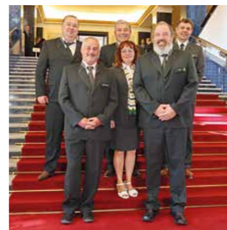
divize VLS Mimoně