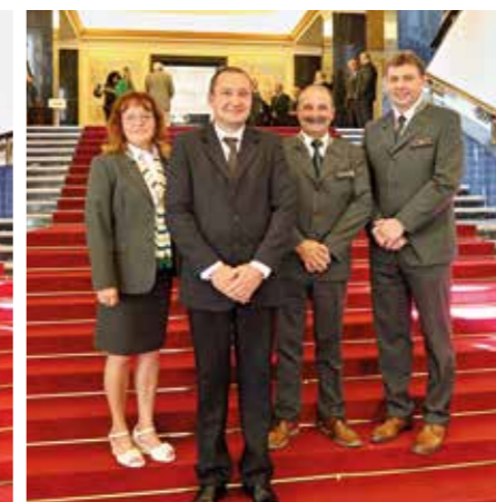
divize zemědělské výroby