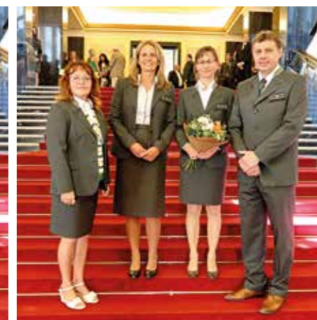
ředitelství státního podniku