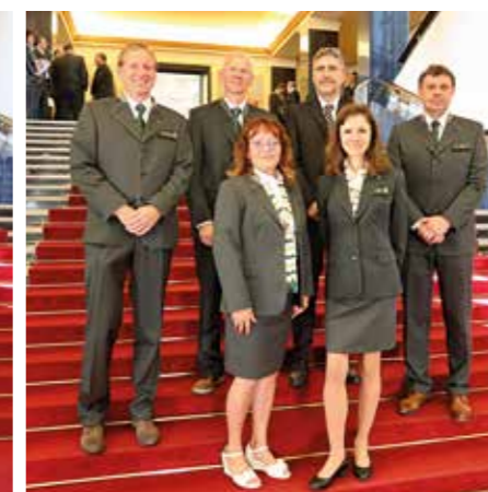
divize VLS Hořovice