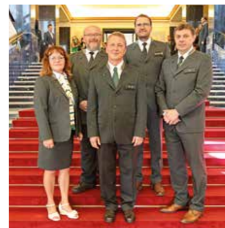
divize VLS Plumlov