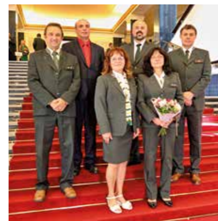
divize VLS Horní Planá