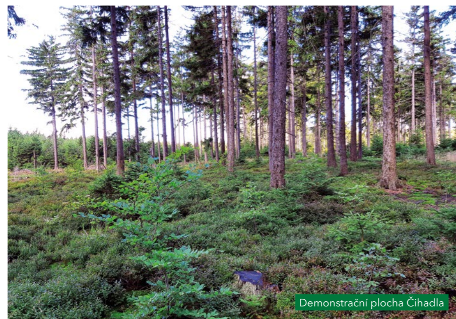
Demonstrační plocha Čihadla

První bylo ustavující zasedání řídicího výboru jakožto nejvyššího orgánu projektu.