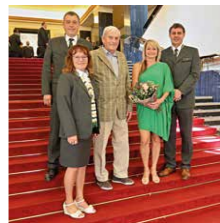
divize ostrahy a služeb