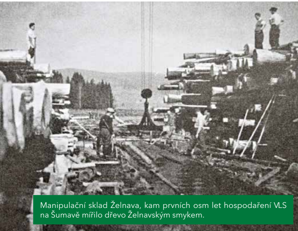
Manipulační sklad Želnavě, kam prvních osm let hospodaření VLS na Šumavě mířilo dřevo Želnavským smykem.