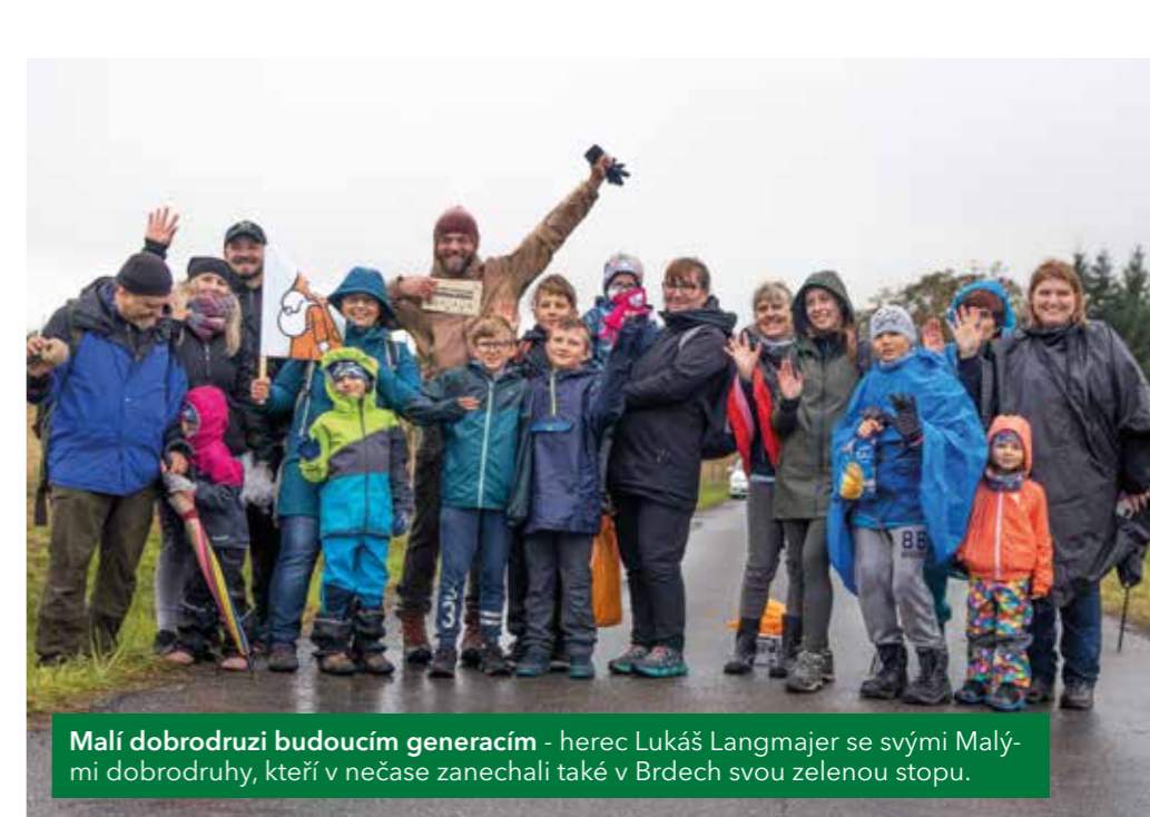
Malí dobrodruzi budoucím generacím - herec Lukáš Langmajer se svými Malými dobrodruhy, kteří v nečase zanechali také v Brdech svou zelenou stopu.

Tři po sobě jdoucí roky s vysokými teplotami a nízkými srážkami vyústily v roce 2015 v šíření kůrovce kalamity napříč středoevropskými lesy. Z lokalit ve správě VLS zničila nejprve rozsáhlé smrkové porosty ve vojenském újezdu Libavá na Olomoucku, pak zasáhla naplno výcvikový prostor Březina na Vyškovsku.