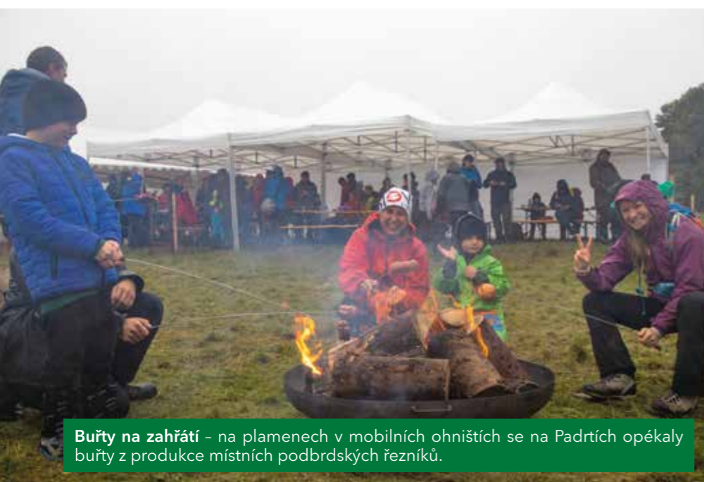
Buřty na zahřátí - na plamenech v mobilních ohništích se na Padrtích opékaly buřty z produkce místních podbrdských řezníků.