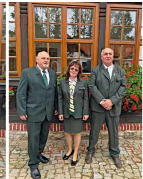
divize Lipník n. B.