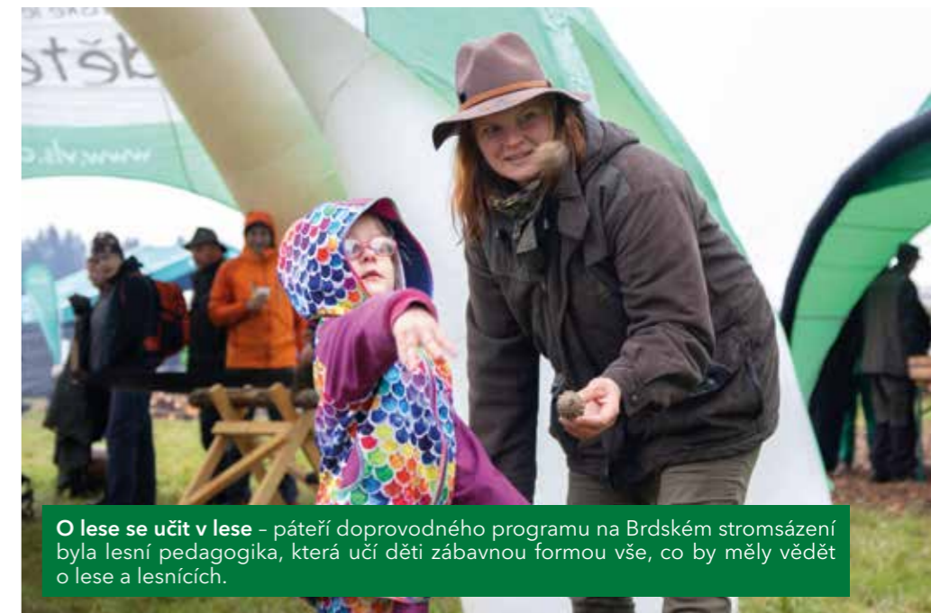
O lese se učít v lese - páteří doprovodného programu na Brdském stromsázení byla lesní pedagogika, která učí děti zábavnou formou vše, co by měly vědět o lese a lesnících.