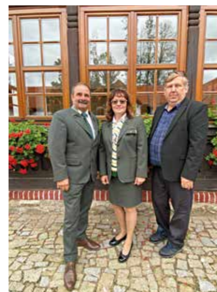
divize zemědělské výroby