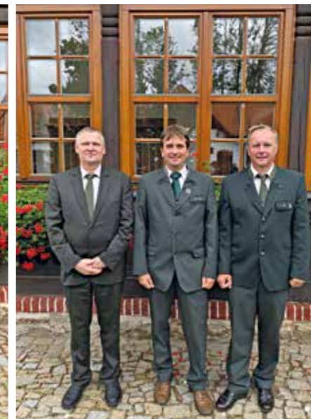
divize Karlovy Vary