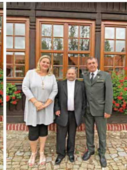
divize ostražky a služeb