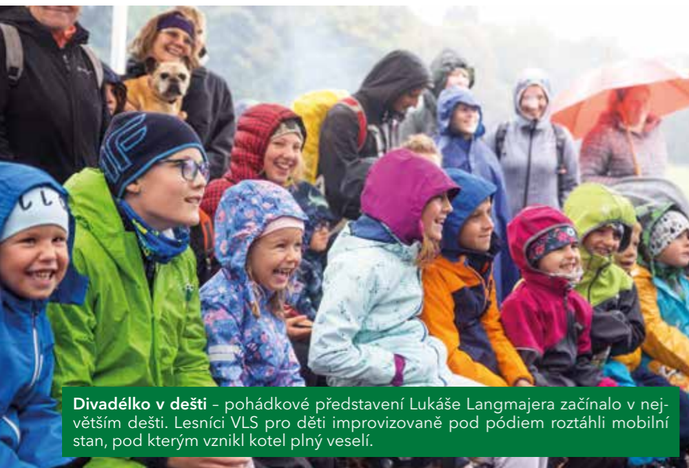
Divadélko v dešti - pohádkové představení Lukáše Langmajera začínalo v největší dešti. Lesníci VLS pro děti improvizovaně pod pódiem roztáhli mobilní stan, pod kterým vznikl kotel plný veselí.