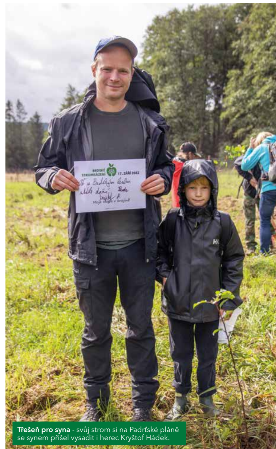
Třešeň pro syna - svůj strom si na Padrťské pláňě se synem přišel vysadit i herec Kryštof Hádek.