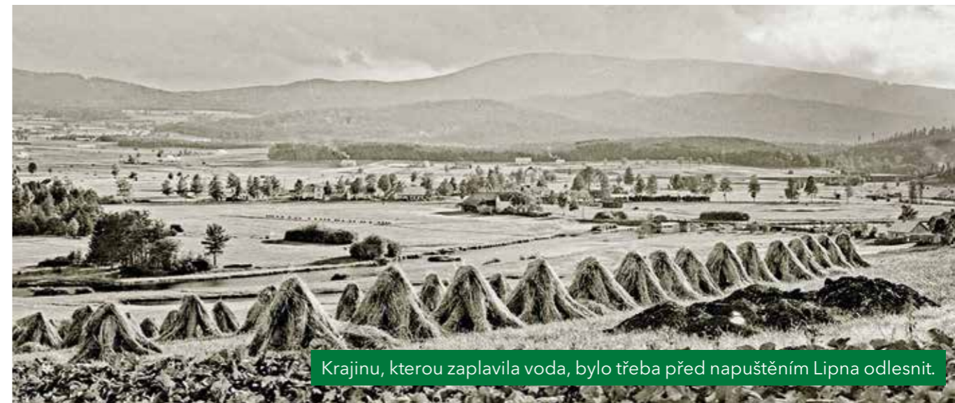
Krajinu, kterou zaplavila voda, bylo třeba před napuštěním Lipna odlesnit.

V úterý 20. prosince oslaví lesnická divize VLS v Horní Plané 70 let od svého založení. Do šumavské krajiny nastoupili lesníci státního podniku v roce 1952, kdy převzali lesní celky po Schwarzenbercích, jejichž lesní hospodaření se stalo legendou. Historie hornoplánské divize je plná významných milníků. V prvních letech ještě plavili dříví po šumavských plavebních kanálech, pak odlesňovali kotlinu, kterou následně zatopila Lipenská přehrada. V mladší historii se pak museli vypořádat s následky orkánu Kyrril.