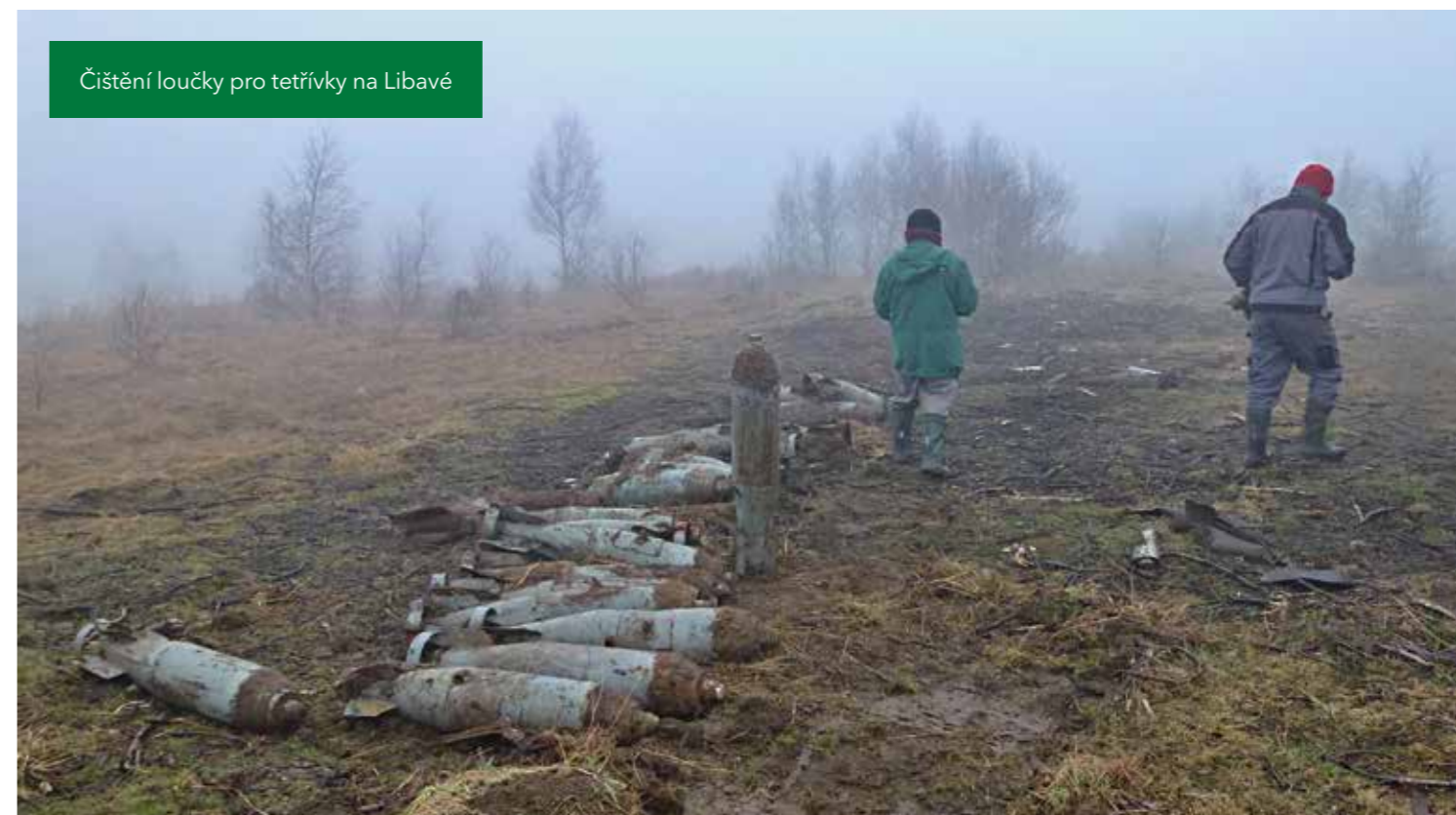
Čištění loučky pro tetřívky na Libavě

Za třináct let ralským pyrotechnikům rukama prošla na šesti lesnických divizích VLS munice všeho druhu. Většinu tvořila typizovaná munice vojsk bývalé Varšavské smlouvy a současných armád, které výcvikové prostory využívají. Vedle toho však posbírali také sbírku munice z II. světové války včetně výzbroje Wermachtu, samostatnou kapitolu tvoří střelivo pověstného sovětského raketometu Kaťuša, kterým se v českých výcvikových prostorech střílelo v 50. letech minulého století.