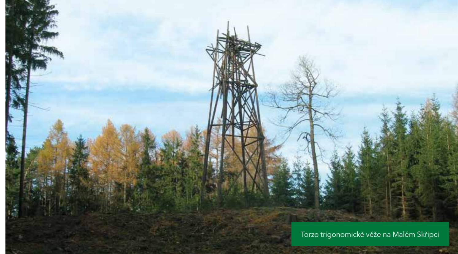
Torzo trigonometrické věže na Malém Skřípci