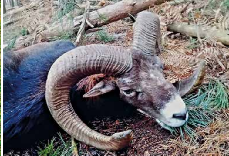
Nejsilnější trofej muflona z Ralska, 208,95 b. CIC