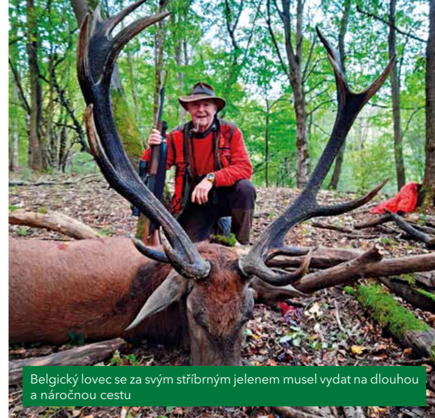
Belgický lovec se za svým stříbrným jelenem musel vydat na dlouhou a náročnou cestu

U jelena evropského to byla pouze jedna zlatá rána, bodově však s hodnotou 213,79 CIC pomyslnému žebříčku u VLS dominovala. Vedle toho se kolegové z Ralska mohou pochlubit dvěma stříbrnými a jedenácti bronzovými trofejemi. Tradičně skvělý výsledek ohlásila severočeská divize také u daňka skvrnitého – čtyři zlaté trofeje (nejlepší 203,74 CIC), stejný