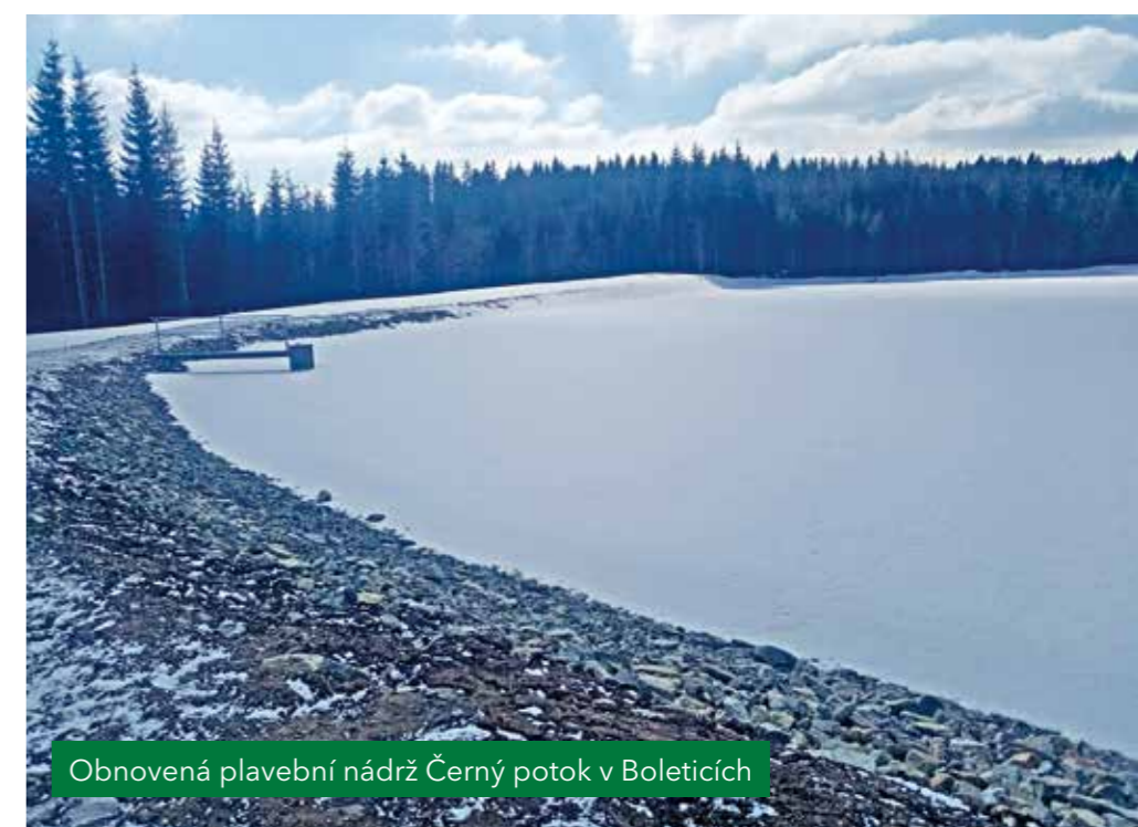
Obnovená plavební nádrž Černý potok v Boleticích

strukturálních fondů Evropské unie. Proto i v loňském roce většinu těchto nákladů pokryly dotace z operačního programu životní prostředí, konkrétně šlo o 21 a půl milionu korun. V letošním roce chceme stejným způsobem spustit projekty na obnovu dvou rybníků v Ralsku, chceme se ale také zaměřit na menší projekty na zadržování vody v lesích, především na tůň a napajedla pro zvěř,“ doplnil ekonomický náměstek VLS Zdeněk Mocek.