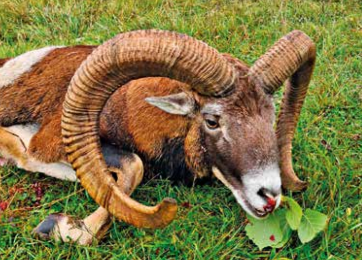
Zlatý beran z Hradiště s bodovou hodnotou 2016,95 b. CIC je nejsilnější mufloní trofej sezóny