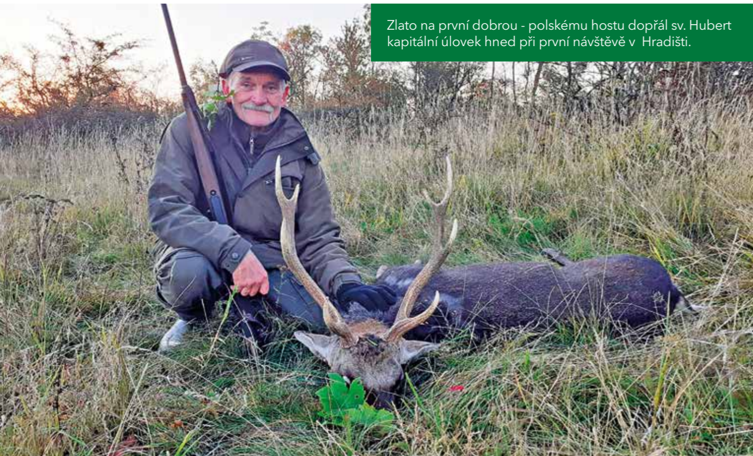
Zlato na první dobrou - polskému hostu dopřál sv. Hubert kapitální úlovek hned při první návštěvě v Hradišti.