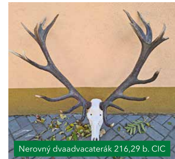
Nerovný dvaadvacaterák 216,29 b. CIC