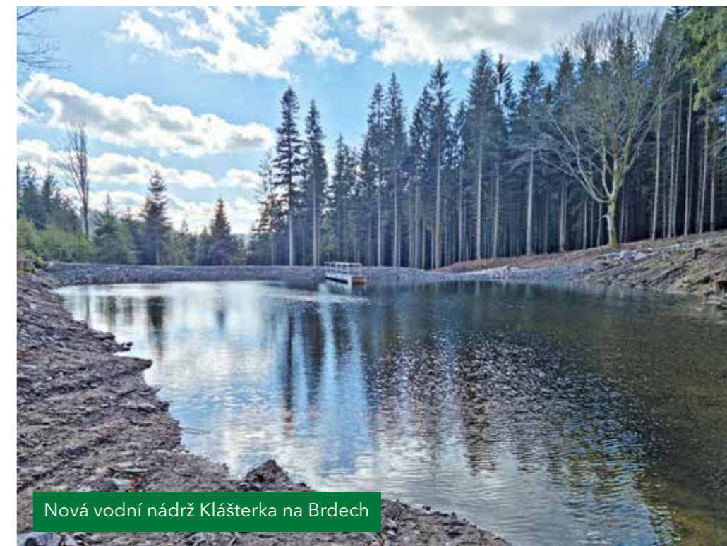
Nová vodní nádrž Klášterka na Brdech

„Na projekty z programu Živá voda VLS využíváme podporu ze