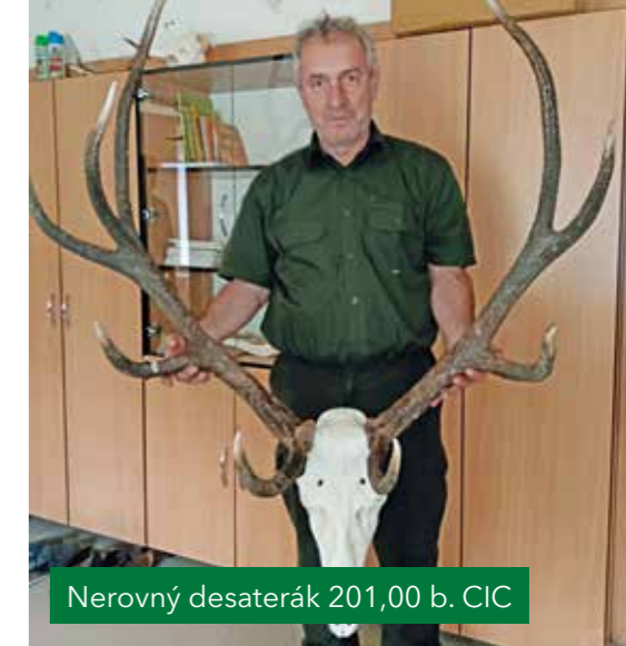
Nerovný desaterák 201,00 b. CIC