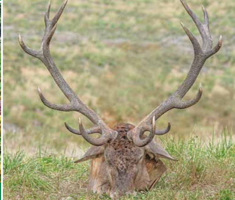
Nejsilnější trofej z Libavé, 213,70 b. CIC