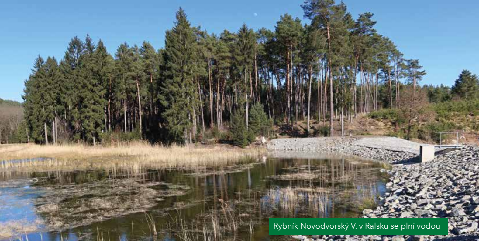
Rybník Novodvorský V. v Ralsku se plní vodou