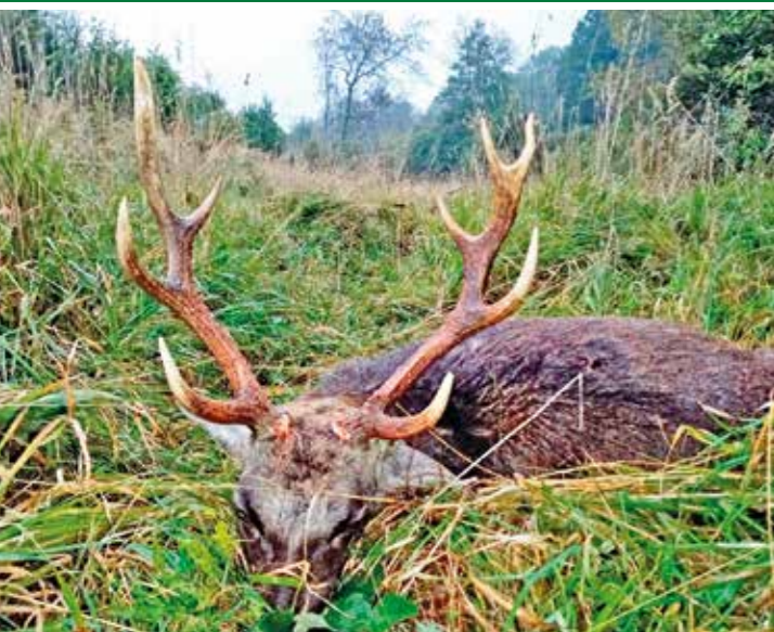
Lovecký host přijel na jelena evropského, domů si odvezl nejsilnějšího siku sezóny. Trofej má zlatou hodnotu 272,10 b. CIC